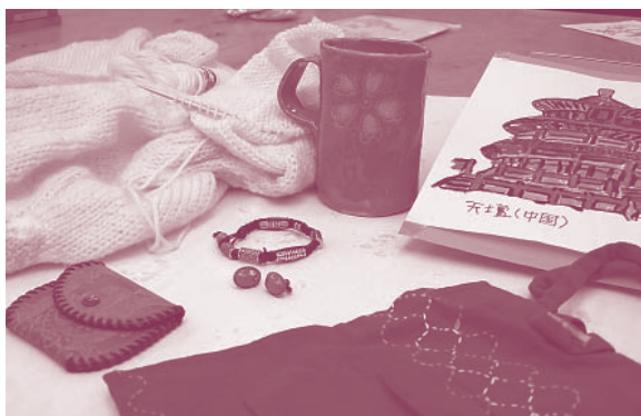
編み物、陶芸、絵画、革製品、アクセサリーやバッグ...作品の数々です。だれでも自分が好きなもの、得意なことがあります。