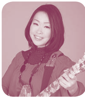
病棟行事でギターを演奏