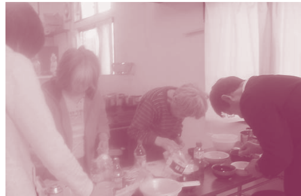
作業棟での料理教室です。本誌連載「わくわく! かんたん! クッキング」のレシピもここで生まれます。

学・器用・デザインセンスが良い・ギターが上手・気配り豊か・優しい」など、A-Tでは、色々な方の良いところをたくさん見せていただき、私たちがスタッフも豊かな時間を過ごさせていただいております。